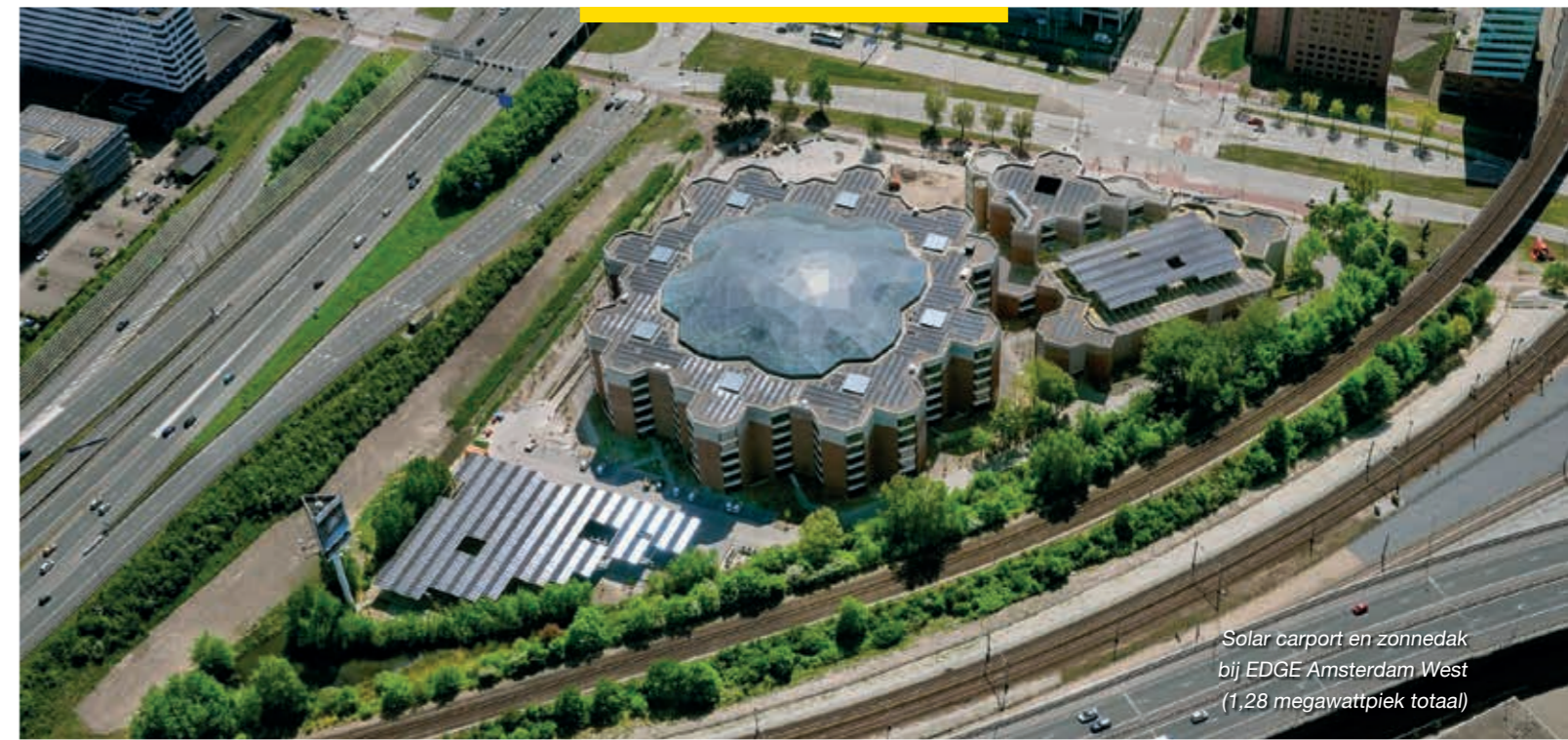
Solar carport en zonnedak bij EDGE Amsterdam West (1,28 megawattpiek totaal)