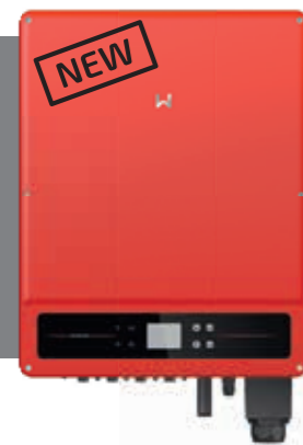
GW 60KS-MT 300 mA RCD compatibel